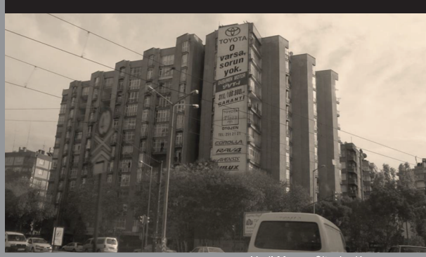
Yeşil Meram Sitesi – Konya

Ön kapak sol üst fot:AKM İstanbul, http://www.mimdap.org/w/wp-content/uploads/akm-eylem.jpg Sağ alt fot: Bilkent Üniversitesi http://www.adaletvehukuk.com/wp-content/uploads/2014/04/bilkent-universitesi_206844-300x225.jpg