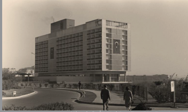
Hilton Oteli - İstanbul