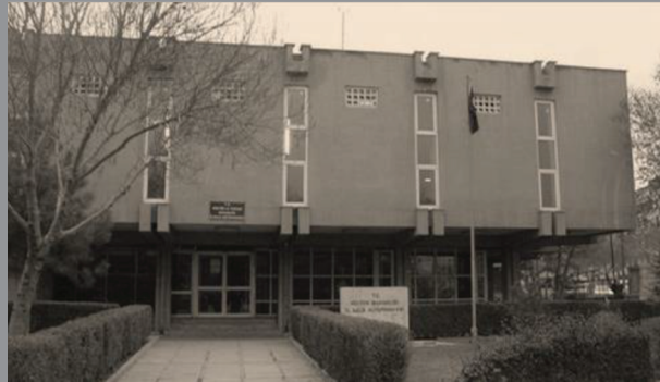
II Halk Kütüphanesi (yıkıldı) - Konya ( http://www.panoramio.com )