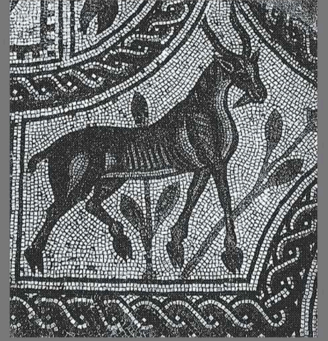
Kuseyr El Hallabat (Can, Gülbudak ve Gökler, 2017)

Arka kapak metin ve ön-arka kapak fotoğraf için kaynak: Can, B., Gülbudak, Ö., ve Gökler, B. (2017). “Fusayfisâ” İslam Mimarisinde Mozaik. Art-Sanat Dergisi, 71-121.