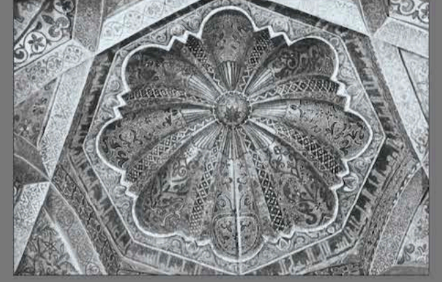
Kurtuba Ulu Cami (Can, Gülbudak ve Gökler, 2017)