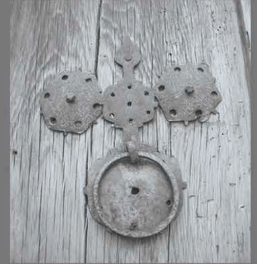
Kışla Mahallesi, "Zerze" Örneği (Özgen, 2018).

Arka kapak metin ve ön-arka kapak fotoğraf için kaynak: