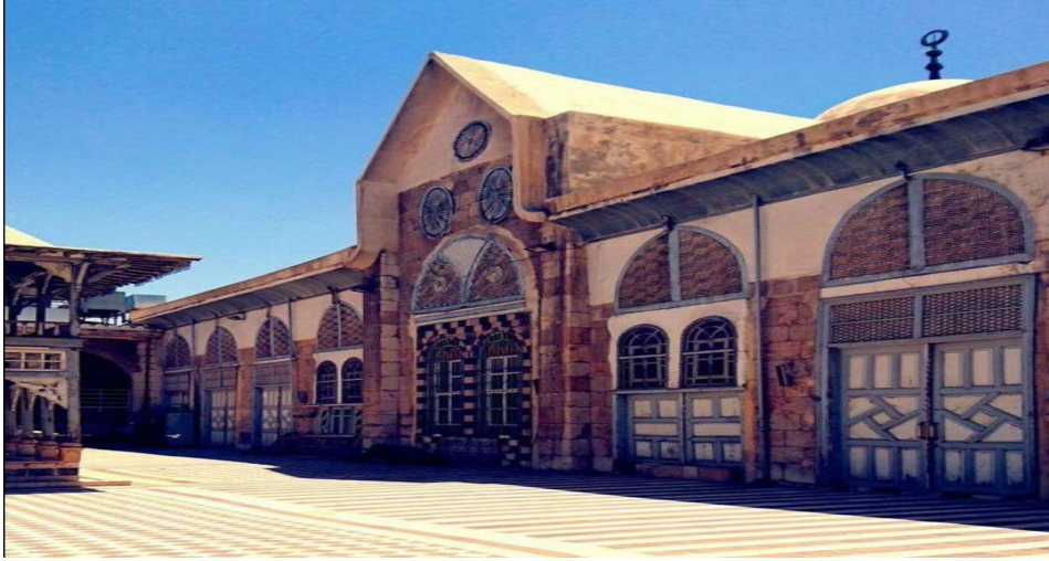
Resim 1. Tövbe Cami; avludan görüntüm 76 .