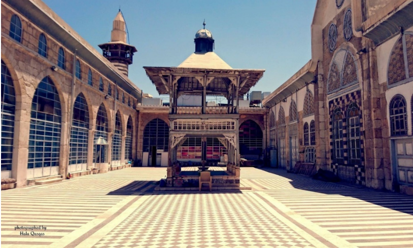
Resim 2. Tövbe Cami Camii Avlu ve Şadırvanı 77 .