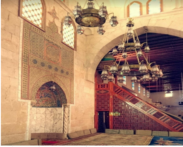
Resim 3. Töve Camiinin minber ve mihrabı 78 .