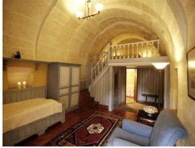
Fot. 20. Otel odalarına ara kat eklenmesi (URL 6)