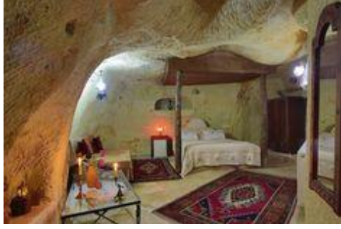
Fot. 18. Kayaya oyulmuş bir otel odasında organik mekânsal biçimlenme (URL 4)

konusudur. Örneğin; kayaya oyulmuş otel odalarında yapısal bir işleve sahip olmaksızın, tasarım arayışı içindeki oyma mekâna sonradan eklenen yerelle uyumlu formdaki mimari elemanlara da rastlanmaktadır (Fot. 19). Bunun yanı sıra tonozlu mekânların geometrik biçimlenmesinden faydalanarak bazı odalara eklenen ara katlar, kullanım alanını artırırken, diğer yandan mekânsal zorlamalara yol açmaktadır (Fot. 20). Mekânsal zorlamalara yol açan bir diğer uygulama örneği olarak, otel odalarındaki banyo ve tuvaletlerin durumundan söz edilebilir. Otel odalarına sonradan eklenmesi kaçınılmaz olan banyo ve tuvaletler bazı yapılarda mekânsal biçimlenmeye aykırı nitelikte kütleli ifade yaratan uygulamalar olarak dikkat çekicidir (Fot. 21).