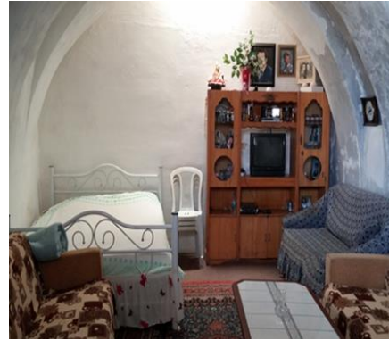
Fot. 12. Odalarda niteliksiz kullanımdan kaynaklanan mekânsal ve donatısal uyumsuzluk örnekleri