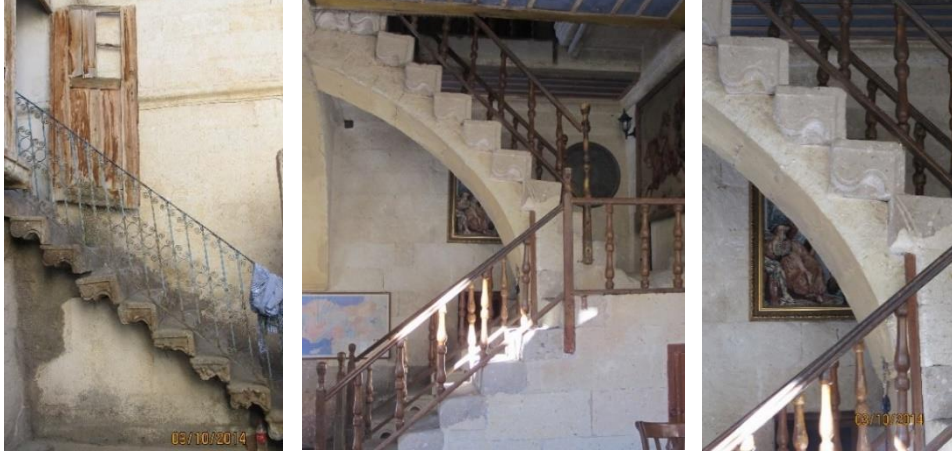
Fot. 3. Mustafapaşa konutlarında avludan çıkılan merdiven örnekleri

Genellikle taştan yapılmış süslemeli merdivenlerle (Fot. 3) avludan çıkılan üst katlardaki odalar ve sofa (Fot. 4 ve Fot. 5) iç mekân kimliği açısından zengin unsurlar içerir. Kimi zaman konukların da ağırlandığı, günlük işlerin yapıldığı sofada raf, niş, lambalık, sedir gibi elemanlar yer alırken yüklük ve gusulhane bulunmaz. Genellikle kemerli pencereleriyle sofalar konutun diğer odalarına göre daha büyüktür ve zengin süslemelere sahiptir. Sinasos konutlarında odaların girişindeki pabuçluk, ahşap ya da taştan yapılmış sedirler, yüklük, bazılarında gusulhane, duvarlardaki nişler, ahşap dolaplar ve ocak iç mekânlardaki karakteristik donatılardır. Odalardan daha konforlu ve gösterişli olanı misafirlerin ağırlandığı başoda olarak planlanmıştır. Konutlarda belirli bir yerde konumlanmamış olsa da Sinasoslu Rumların ibadet için kullandıkları ikona nişleri bulunmaktadır.