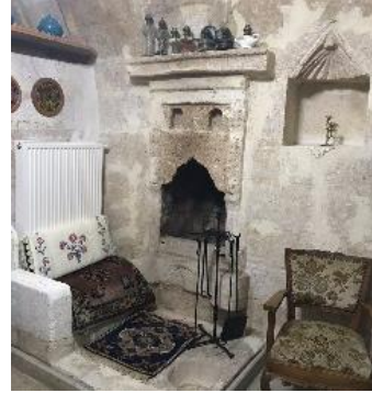
Fot. 11. Mekânsal konfora yönelik bir eklemleme-kalorifer (URL 1)