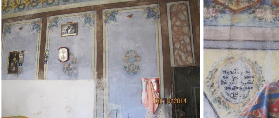
Fot. 13. Sinasos konutlarında iç mekânda niteliksiz kullanım ve bakımsızlıktan dolayı belleğin yitirilişi