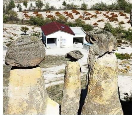
Fot. 17. Kaçak yapılaşmalara bir örnek (URL 3)

Sinasos'taki konutlarda turizm odaklı işlevsel değişimler bir yandan koruma açısından risk oluşturan müdahalelere yol açarken, bir yandan da mekânsal kimlik sorunsalının yaşandığı günümüzde, yerel ve nitelikli yaşamı değerli kılan farkındalıklara yol açtığı düşünüldüğünde koruma açısından bir fırsat olarak değerlendirilebilir. Bu fırsatın iyi değerlendirilmesi için yapılardaki işlev değişikliği sağlıklı kararlarla gerçekleştirilmeli, tüketime yönelik ticari yaklaşımların etkisinde kalınmamalıdır. Tarihi yapılarda yeniden işlevlendirme ilkelerine göre, mekânsal potansiyeli aşan fiziksel müdahalelerden ve mimari karakteristiklere aykırı uygulamalardan kaçınılmalıdır. Sinasos'taki otellerin iç mekânlarında farklı tasarım yaklaşımları sergilenmektedir. Bazı otellerin kayaya oyulmuş odalarında mekânların doğası gereği var olan organik yapılanma, donatıların ve iç mekânların biçimlenmesinde etkili olmuştur (Fot. 18). Mevcut mekânsal yapı ile uyumlu bu tasarım anlayışının aksine yaklaşımlar da söz