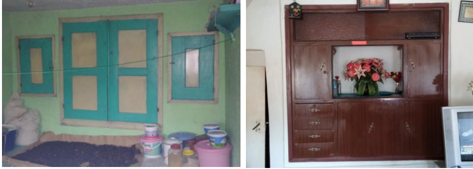
Fot. 15. Duvar içine gömülmüş yüklük adı verilen gömme dolapların günümüze uyarlanması

Oldukça sağlam yapılı bir malzeme olan yöresel taştan inşa edilmiş Sinasos Konutlarının fiziksel ömürleri işlevsel ömürlerinden uzundur. Toplumsal gelişmelerin ışığında bu yapılar konut olarak kullanıldığı sürece mekân ölçeğinde, konut olarak kullanımı sona erdiğinde ise yapı ölçeğinde işlevsel değişimlere uğramaktadır. Mekân ya da yapı ölçeğindeki bu işlevsel değişimler, kullanıcının ya da tasarımcının kararına bağlı olarak gerçekleşebilir.