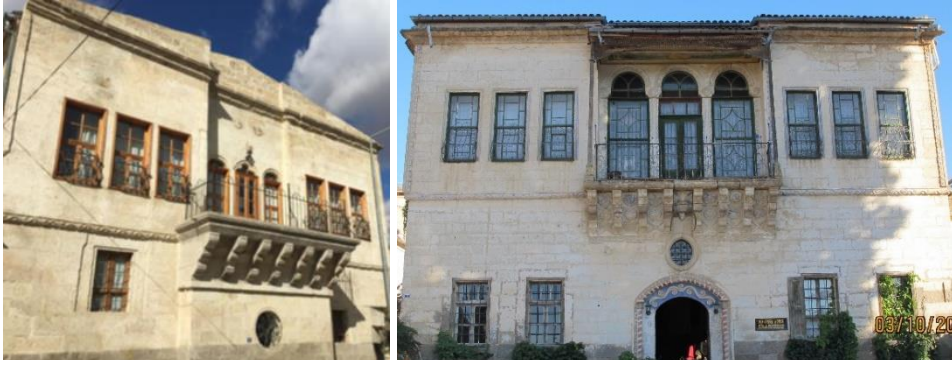
Fot. 6. Mustafapaşa konutlarında cephe örnekleri

Taşın doğal renginin egemen olduğu konutlarda bezemeli çatı ve kat silmeleri, kemer dizileri, tepe pencereleri, çörtlenler, konsollar, balkonlar ve çıkmalar cepheye hareket kazandıran unsurlardır (Fot. 6). İç sofalı plan tipinde bezemeli kemerli pencereler ve balkonlarla sonlanan sofalar, düz atkılı pencerelere sahip her iki yandaki odalardan ayrışarak bol açıklıklı üst kat cephesinde simetri oluşturmuştur. Genellikle bezemeli kemerler içine oturtulan birbirinden farklı ahşap kapılar cephe kimliğinde etkilidir.