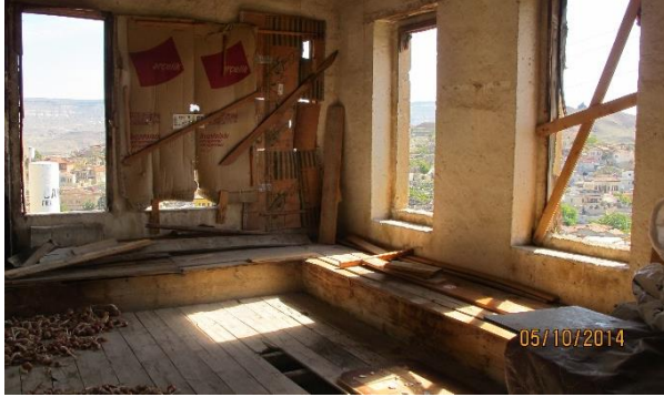
Fot. 10. Bakımsızlık ve terkten kaynaklanan mekânsal ve yapısal bozulmalar

Mustafapaşa'da kullanımı devam eden konutlar, kullanıcıdan kaynaklanan müdahalelerle günümüz şartlarına adapte olmaya çalışmaktadır. Bu adaptasyonu gerçekleştiremeyen konutlarda ise, bakımsızlık ve terkten kaynaklanan mekânsal ve yapısal bozulmalar ortaya çıkmaktadır (Fot. 10). Diğer yandan, sağlıklı bir adaptasyon süreci geçirmeyen konutlarda yaşam zorlaştıkça iç mekânlarda niteliksiz kullanımdan kaynaklanan mekânsal bozulmalar ortaya çıkmaktadır. Geleneksel konutlarda yatma, oturma, depolama vb. eylemlerin bir arada yer aldığı odalar, çok işlevli kullanımını günümüz şartlarına uygun mobilyalarla sürdürürken mekânsal ve donatısal uyumsuzluklar ortaya çıkmaktadır (Fot. 12). Çoğu zaman kullanıcıların sosyal ve ekonomik durumuna uyumlu, estetik ve beğeni anlayışını yansıtan isteğe bağlı bu yaklaşımlar konutlarda kullanıcı ile mekân arasındaki ilişkiyi güçlendirerek aidiyet duygusunu artırmakla beraber, Sinasos konutlarının mimari biçimlenişine aykırı düzenler ortaya koymaktadır. Bunun yanı sıra konutların sürdürülebilir nitelikte korunabilmesi için ihtiyaç olan mekânsal konfora yönelik müdahaleler de söz konusudur. Eskiden ısınmak için kullanılan ocakların yerini alan kalorifer sistemleri bunlardan biridir (Fot. 11). Sonuçta, isteğe ya da ihtiyaca bağlı her türlü müdahalenin konutlarda geri dönülebilir nitelikte uygulamalar olmasına özen gösterilmelidir.