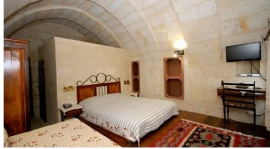
Fot. 21. Otel olarak kullanılan yapının çatı eklenmesi (URL 7)