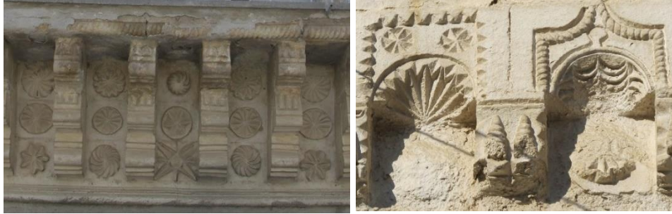
Fot. 7. Mustafapaşa konutlarında taşın işlenerek elde edildiği motif örnekleri

Mustafapaşa konutlarında süsleme gerek cephe, gerekse iç mekân kimliğinde etkili bir unsurdur. Taş, maden ve ahşap malzemenin kullanıldığı süslemeler geometrik, bitkisel, figürlü ve kaligrafik olarak dört başlıkta incelenebilir (Davulcu, 2014, s.57). Kolaylıkla şekillenen yöresel taş malzemenin kullanıldığı süslemelerle Mustafapaşa konutları oldukça gösterişlidir ve karakteristiktir (Fot. 7).