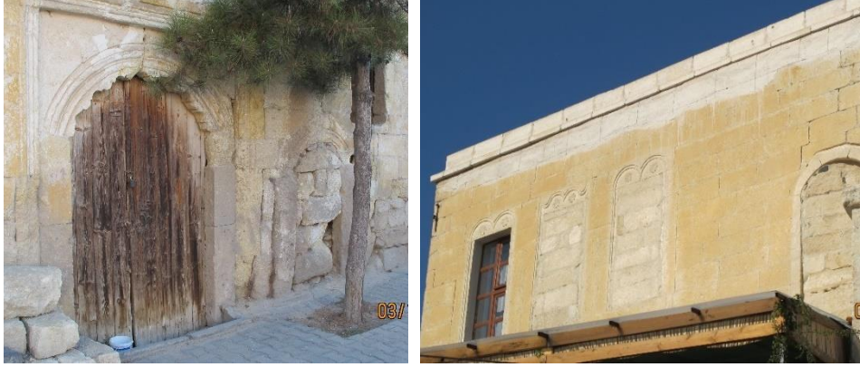
Fot. 14. Sinasos konutlarında cephedeki iptal uygulamaları: Soldan sağa 1-Avluya girilen küçük kapıların iptali, 2-Pencerelerin iptali