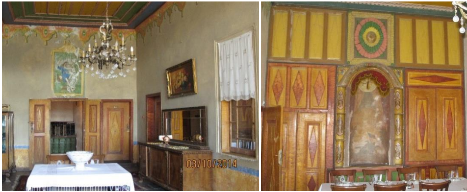
Fot. 4. Mustafapaşa konutlarında sofa