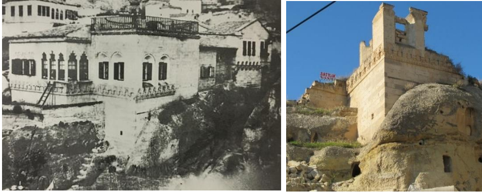
Fot. 9. Mustafapaşa'da büyük bölümü yıkılmış olan Doktor Sarandis P. Arhaleos'un Evinin ayakta kalan bölümü (Sol-Balta, 2007, sf.136; Sağ-Yıldırım Gönül Arşivi, 2014)

Mustafapaşa konutlarında strüktür ve malzemeye ilişkin yapısal bozulmalar doğal olayların yanı sıra bakımsızlık, terk ve eskimenin de etkisiyle ortaya çıkabilmektedir. Yapılarda fiziksel açıdan yıpranmışlığa neden olan bu bozulmalar; yöresel taş malzemede yüzey kayıpları, oyuklanmalar, parça kopması veya çatlaklar şeklinde oluşabilir. Yağmur ve rüzgarın etkisiyle ıslanıp kuruyan taş yüzeyler aşınarak oyuklanmalara ve parça kopmalarına neden olmaktadır. Zamanla yüzeylerdeki bu kayıpların artmasıyla bozulma alanı genişleyerek taşın kesiti küçüldüğünde yapılarda strüktürel sorunlar ortaya çıkmaktadır. Diğer yandan, yer sarsıntılarının neden olduğu doğal ya da mekânik etkilerle oluşan kılcal ve yapısal çatlaklar da yapısal bozulmalara yol açmaktadır. Bütün bu yapısal bozulmaların artmasıyla Mustafapaşa'da yok olmak üzere olan konutlara rastlanmaktadır (Fot. 9).