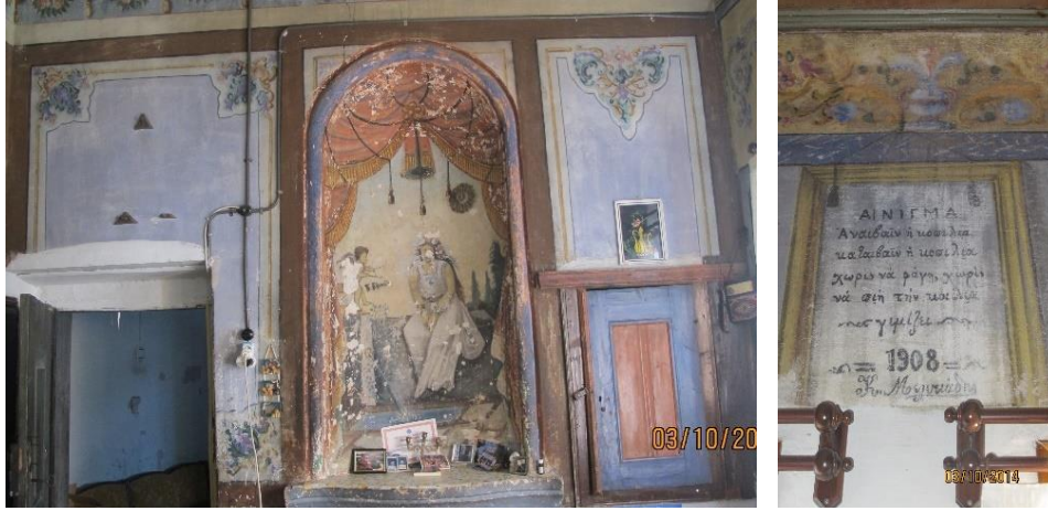
Fot. 1. Mustafapaşa'da Sinasos'lu Rumlara ait bir konut (Yıldırım Gönül Arşivi, 2014)

Rumlardan, %20'si Türklerden oluşan Sinasos, ekonomik ve sosyo-kültürel açıdan gelişmiş bir yerleşimdir. Geçmişte yerleşimin dini/etnik yapısındaki bu çeşitliliğin izlerine bugün de Mustafapaşa konutlarında rastlamak mümkündür (Fot. 1, Fot. 2). Mübadeleden sonra Rumların terk ettiği bölgeye Selanik'ten gelen Türklerin yerleşmesiyle demografik yapı farklılaşmıştır. Böylelikle, Sinasoslu yerli halk ile Selanikli mühacir halk yerleşimin yeni nüfusunu oluşturmuştur. Her ikisi de Müslüman ve Türk olmasına rağmen kültürel açıdan birbirinden farklı gruplardır. Rumların terkettiği konutlar öncelikle savaş ortamındaki yerli halk tarafından paylaşılmış, ardından kalanlara da Selanik'ten gelen Türkler yerleştirilmiştir. Her iki kesim de ihtiyaç sahibidir. Anadolu'nun pek çok yerinde olduğu gibi, Sinasos'ta da gelir sağlamak amacıyla yapı malzemelerinin satışı savaşın harap ettiği konutlardaki bozulmaları arttırmıştır.