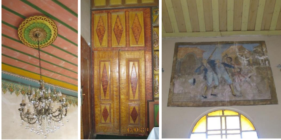
Fot. 8. Mustafapaşa konutlarında iç mekân süslemelerinden örnekler: Soldan sağa 1-Ahşap tavan göbeği, 2-Ahşap kapı, 3-Avrupa etkisi altındaki duvar resimleri

duvarlardaki nişler zengin motiflerle bezenmiş yapıdadır. Üst katlarda odaların duvarlarındaki dairesel kesitli nişlerde ya da duvar yüzeylerinde, dini ve sosyal yaşama dair sahneler resmedilmiştir (Fot. 8-3). Avrupa etkisi altındaki bu resimler, konutlardaki etnik değişimin göstergelerinden biri olarak, mübadeleden önce gayrimüslimlerin (Rumların) Sinasos'daki yaşamına dair izler barındırmaktadır.