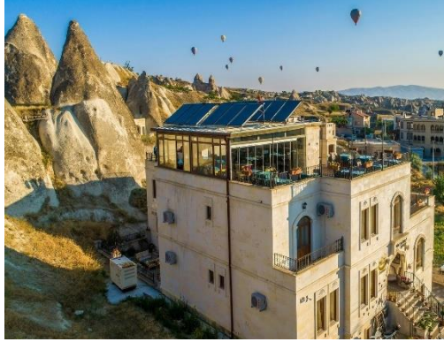
Fot. 16. Otel olarak kullanılan yapının çatı eklemlemesi (URL 2)

uygulamadır. Otel ve/veya pansiyon olarak kullanımını sürdüren Sinasos Konutları küresel-yerelleşme veya glocalisation olarak da bilinen küre-yerelleşme odağında, otantiklik anlayışı üzerinden kullanıcının ilgisini çekmektedir. Ancak turizm sektörünün var olanla yetinmeyerek, konforu arttırmaya yönelik bir eğilimle büyümeyi hedefleyen yapısı, zaman zaman doğal ve kültürel mirasımızı tehdit eden bir unsur haline gelmektedir. Yapılarda kaya içine oyulan mekânların yanı sıra dışarıdan bakıldığında da görülebilen nitelikteki kütsel eklemlemelerin kontrolünde güçlükler yaşanmaktadır (Fot. 16). Tüketim kültürünü hedef alan bu yaklaşımla bölgedeki yerleşimlerde kontrolünü kaybeden turistik yapılaşmalar tarihi çevre ve yapılarda büyük hasarlara yol açabilmektedir. Hatta son zamanlardaki denetimlerde fark edilerek yıkımı gerçekleştirilen pek çok kaçak yapılaşma ortaya çıkmıştır (Fot. 17). Kaçak yapıların ortadan kaldırılması ile kentsel bir sorun yok olurken, doğal çevreyi tehdit eden bir başka sorun oluşmuştur. Yıkımlardan sonra Aşk Vadisine ve Kılıçlar Vadisine dökülen hafriyatlar yığınlar halinde beklemektedir.