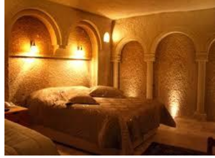
Fot. 19. Kayaya oyulmuş bir otel odasında sonradan eklenen yerelle uyumlu formdaki mimari elemanlar (URL 5)