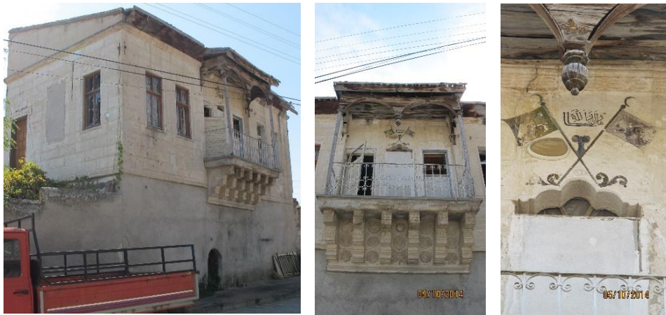
Fot. 2. Mustafapaşa'da Sinasos'lu Türklerle ait bir konut