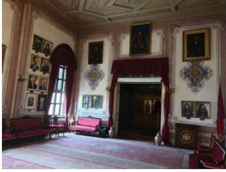
Fot. 16. Heybeliada Ruhban Okulu tören salonu.

Tören odasının duvarlarına, okulda önceden hizmet vermiş olan öğretmenlerin ve din görevlilerinin tabloları ve fotoğrafları asılmıştır. Odada süslemeler dışında günümüze korunarak gelmiş 19. yüzyıla ait çeşitli mobilya örnekleri bulunmaktadır. Tören odasının kuzey yönünde, kapısında kırmızı perdeleri olan küçük bir ibadet mekânı yer almıştır (Fot. 16). Okulun avlusunda, ortada bazilikal planlı ve üç nefli Aya Triada Kilisesi bulunmaktadır. Kilisede orta nefin üstü beşik tonoz ile örtülmüştür. Giriş kısmı ise pasalı ahşap tavan şeklinde düşünülmüştür. Kilisenin apsis duvarı önünde mezarlar yer almıştır (Fot. 17).