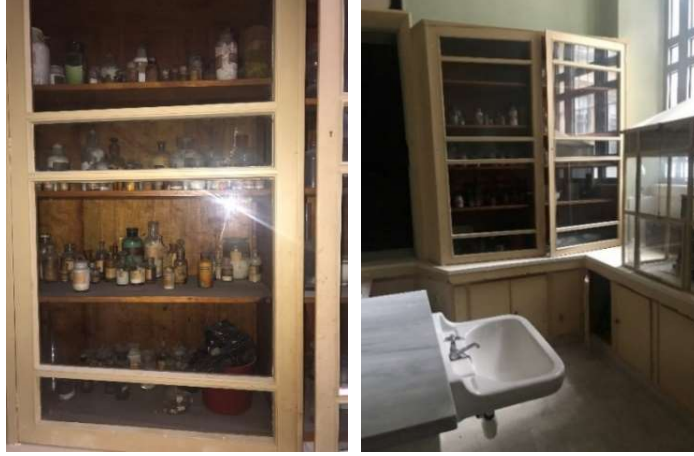
Foto 5. Ruhban Okulu'nda, günümüze korunarak gelen laboratuvar

giriş katında yıldız karosiman (Fot. 7), mutfak binasında ise farklı desenli döşeme karoları kullanılmıştır (Fot. 8). Mutfak binasındaki döşeme karolarının farklı renkteki bir örneği Haydarpaşa Mekteb-i Tıbbiye-i Şahane Binası'nda da uygulanmıştır 5 (Fot. 9).