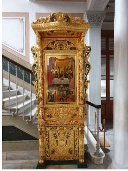
Fot. 14. Heybeliada Ruhban Okulu ana giriş merdiven holündeki kalemişleri (Kaynak: Yazar arşivi, 2018).

Ahşap tavanın merkezinde yer alan haç işaretinin, etrafında dört yönde aynı şekilde ahşap çıtalarla yerleştirilmiş haç işaretleri yer almıştır. Merkezdeki hacın her iki uzun kolu yönünde ortasında “kerubin (serafin)” yer alan ahşap çıtalarla oluşmuş üçgenler düşünülmüştür (Anonim, 2012, s:29). Diğer boş kalan alanlarda, ahşap çıtalardan oluşan simetrik ve geometrik şekillerin içleri çeşitli bitkisel, geometrik motifler ve palmet motifleri ile bezenmiştir (Fot. 15).