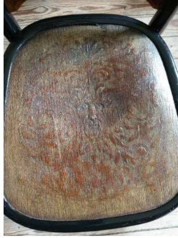
Fot. 4. Heybeliada Ruhban Okulu'nun günümüze korunarak gelmiş sınıflarındaki ahşap sandalyelerde yer alan insan yüzü tasviri

Ruhban Okulu'nun ana bina ve mutfak binası zemin döşemelerinde özgün Karosiman karolar kullanılmıştır. Zemin kaplama malzemesi olarak ana binanın