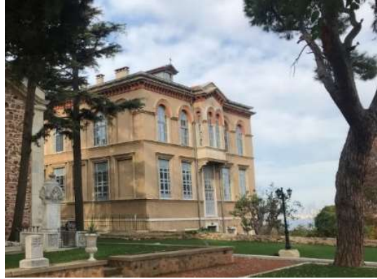
Fot. 2. Heybeliada Ruhban Okulu arka cephesi.

Sınıflar, pencereler ile hem dış mekâna hem de koridora açılmıştır. Sınıftan gelen ışık koridorları aydınlatmış, aynı zamanda söz konusu pencereler koridordan sınıf içini görebilme ve denetleyebilme imkânını sağlamıştır (Fot. 3). 19. yüzyılda okullarda çoğunlukla sıra şeklindeki oturma elemanları kullanılmıştır. Ruhban Okulu'nda da sınıflarda oturma eylemi için, yapıldığı dönemden günümüze ulaşan oturma sıraları ve sandalyeler tefriş elemanı olarak kullanılmıştır. 20. yüzyıl başlarından günümüze gelen özel yapım ahşap sandalyelerin oturlan yüzeylerinin üstünde insan yüzü tasviri yer almıştır (Fot. 4).