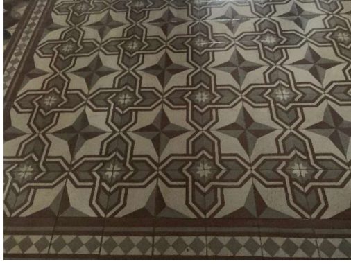
Fot. 7. Ruhban Okulu'nun giriş kat koridorlarında yer alan karosiman döşemeler.