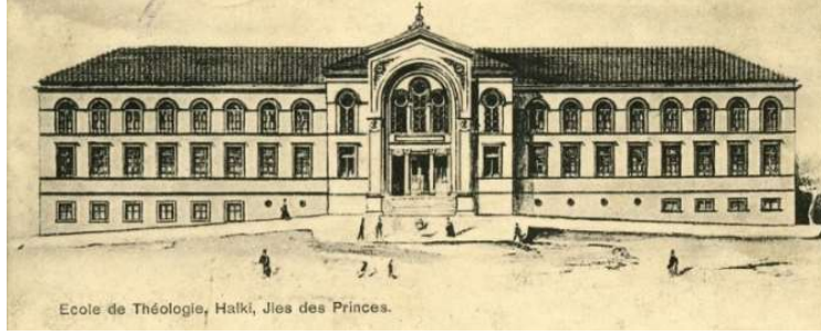
Fot. 1. Heybeliada Ruhban Okulu'nu ön cephesinden gösteren bir kartpostal, No. Krt_006576

Yapının tüm dış cephesinde uygulanan, saçak altındaki tuğla korniş sırası ile üst kat pencerelerinin tuğla kemerleri cephelere ritm, hareket ve uyum kazandırmıştır. Yapının arka cephesinde, birinci katın orta aksında konsollara dayanmış birer cumba yer almıştır. Cumbalara ön kısımda ikişer pencere, yanlarda ise birer pencere açılmıştır. Cumbalar ana girişte öne çıkan kütle gibi üçgen alınlık ile son bulmuştur (Fot. 2).