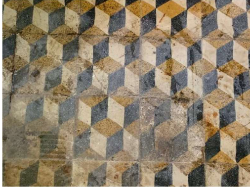
Fot. 8. Mutfak binasında yer alan karosiman döşemeler.