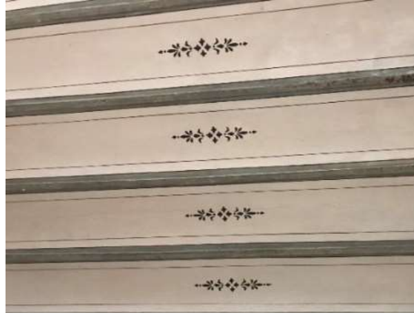
Fot. 11. Heybeliada Ruhban Okulu'nun giriş kat koridor tavanlarındaki kalemişi süslemeli volta döşeme

Başbakanlık Osmanlı Arşivi'nde Heybeliada Ruhban Okulu'nun yeniden inşaatı ile ilgili okulun plan ekindeki belgelerde, inşaat sırasında ilave edilen mutfak ve çamaşırhane binasının ölçümlerinden ve masraflarından