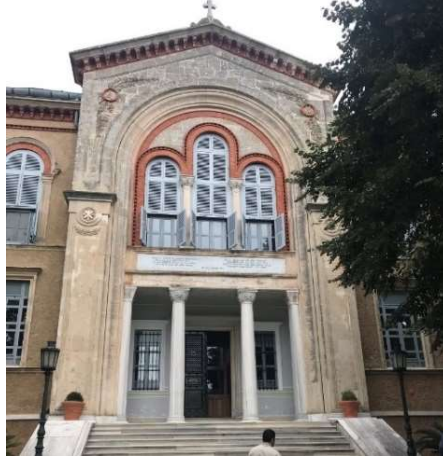
Fot. 13. Heybeliada Ruhban Okulu'nun giriş cephesinden bir görünüm (Kaynak: Yazar arşivi, 2018).

Yapı, cephe düzenlemesi açısından Neo-Grek ve Neoklasik olmak üzere, iki farklı üslup göstermektedir. Kat araları, yatay düzlemde oluşturulan ve tüm cephe boyunca devam eden silmelerle vurgulanmıştır. Yapı, bu özellikleriyle Neoklasik bir üsluba sahiptir. Akroterli üçgen alınlık, girişteki sütunlar ve grekçe kitabede ise Neo-Grek üslubun tercih edildiği görülür.