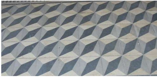
Fot. 9. Haydarpaşa Mekteb-i Tıbbiye-i Şahane Binası kabul salonu zemininde yer alan karosiman örneği.

19.yy'ın geleneksel yapı sistemi olan tuğla dolgulu volta döşeme, yapının bodrum, zemin ve birinci kat döşemelerinde uygulanmıştır 6 (Fot. 10-11). Heybeliada Ruhban Okulu'nun güney ucundaki, mutfak ve çamaşırhane binası,