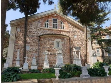
Fot. 17. Aya Triada Kilisesi.