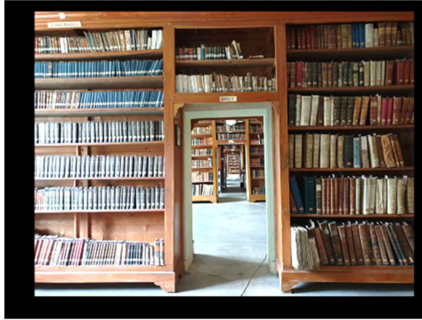
Fot. 6. Heybeliada Ruhban Okulu'nun kütüphanesi