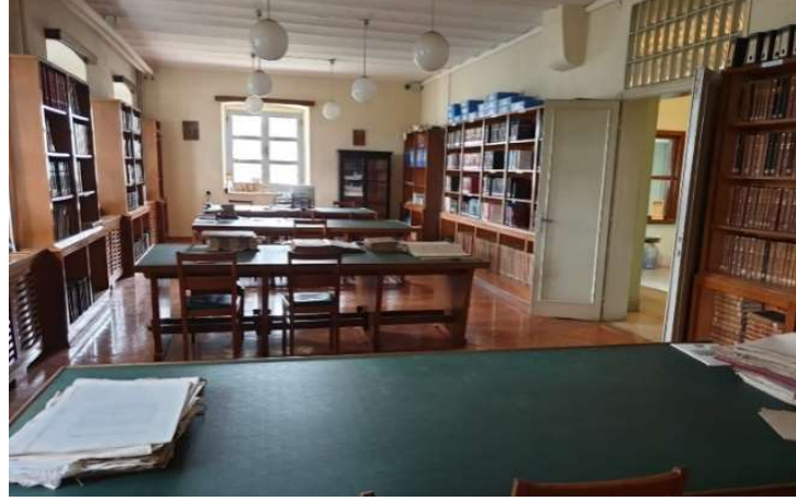
Fot. 10. Heybeliada Ruhban Okulu'nun bodrum kattaki kütüphane tavanındaki volta döşeme.

tek katlı, kâgir ve yığma sistemli bir yapı olarak düşünülmüştür (Fot. 12). Mutfak binasının tavanında ana binada olduğu gibi “Volta döşeme” sistemi uygulanmıştır. Fakat son zamanlarda geçirdiği bir takım tadilatlar, özellikle mutfak mekânında iç mekân özgünlüğünün kaybolmasına yol açmıştır.