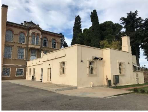
Fot. 12. Heybeliada Ruhban Okulu mutfak binasının dıştan bir görünümü

bahsedilmektedir. 7 Mektebin planında, o dönem gayri müslim okullarında görülen U şekilli planın uygulandığı görülür. Plana mektebin kat planları ve cephe görünümü çizilmiş ve mimarı Periklis Fotiadis tarafından sağ alt köşeye imzası atılmıştır (Şekil 2 ve 3).