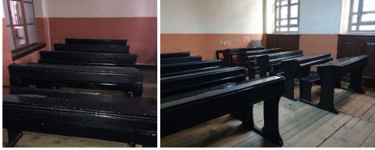
Fot. 3. Heybeliada Ruhban Okulu'nun günümüze korunarak gelmiş sınıflarından

Okulların iç mekânlarının ihtiyaç programına göre tasarlandığı görülmektedir. Binanın bodrum katında kütüphane, giriş katında sınıflar, etüd odaları, fizik - kimya laboratuvarı, birinci katında ise büyük tören salonu, müdür ve öğretmen odaları, sekreterlik, yatılı kalan öğretmenlerin yatak odaları ve teoloji bölümü talebeleri için yatakhane bulunmaktadır. Eski laboratuvar sınıfı da derslikler gibi sergilenmektedir (Fot. 5). İstanbul'da kurulan Saint Joseph Fransız Okulu gibi okullarda bu tarz mekânların ya da bu mekânlara ait bazı aletlerin günümüze korunarak geldiği ve Ruhban Okulu'nda olduğu gibi sergilediği görülmektedir. Bodrum katında yer alan kütüphanede, çok sayıda dini, felsefi ve edebi eser bulunmaktadır. Özellikle Eski Yunanca kitapların sayısı daha fazladır (Fot. 6).