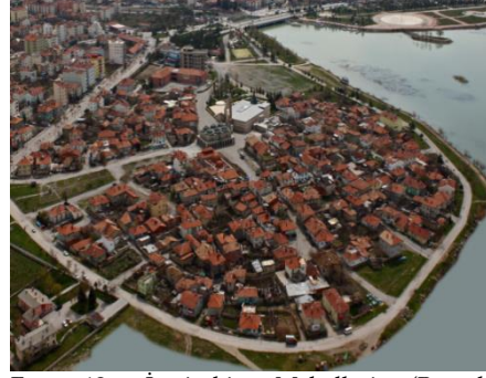
Fot. 12. İçerişehir Mahallesi.