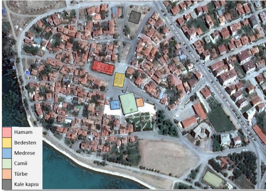
Harita 3. Eşrefoğulları Süleyman Bey Külliyesi içerisinde yer alan eserlerin konumu.

İçerişehir’de alışveriş yapanlar arasında yoğun sosyal ilişkiye imkân veren, ticaretin gelişmesini sağlayan dinamik unsur Süleyman Bey Camii’nin kuzeyinde, hamam ile cami arasında bulunan Süleyman Bey Bedestenidir (Harita 3, Şekil 1).