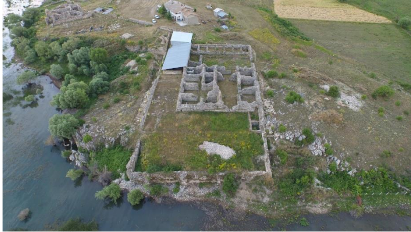
Fot. 3. Kubad Abad Sarayı, "Büyük Saray" ın Planı, [URL-2].

Arkeolojik bulgular Kubâd-âbâd saray yerleşkesinde, saraylar ve köşkler ile av hayvanları bahçesi gibi Sultan ve maiyetinin eğlenme-dinlenme mekânları yanında konutlar ile hamam, su kanalları, tersane gibi kentsel sosyal ve teknik altyapı öğelerinin varlığını ortaya koymaktadır. Bu tespitler, Kubâd-âbâd sarayı yapı gruplarının tarihsel süreç içinde kentsel yerleşme niteliği kazandığını düşündürmektedir. Nitekim Kubâd-âbâd subaşı Bedreddin Sutaş adına