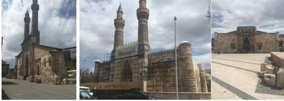
Resim 3: Çifte Minareli Medrese, Gökmedrese ve Buruciye Medresesi (27.04.2016).