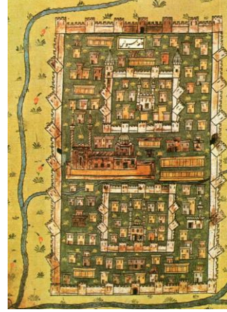
Resim 2: Matrakçı Nasuh tarafından Sivas kent ve surlarının anlatımı, kaynak: Kuban, 2008: 67.