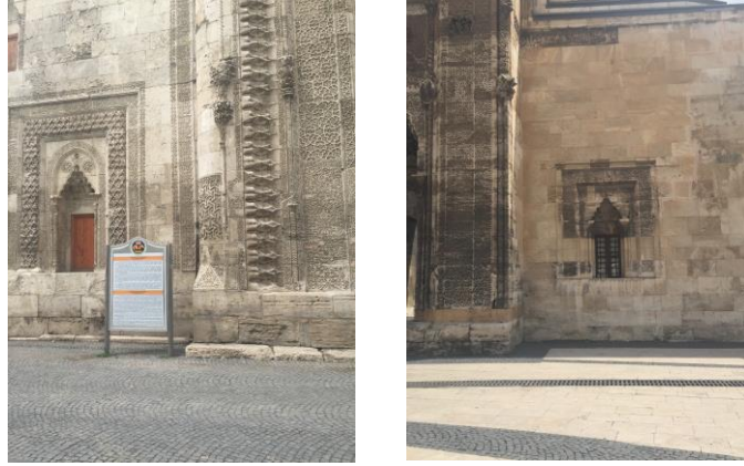
Resim 7: Çifte minareli Medrese ve Buruciye Medresesinden pencere detaylarını gösteren fotoğraflar (27.04.2016).