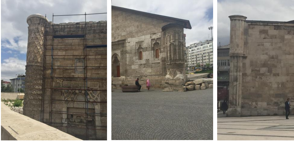
Resim 5: Gökmedrese, Çifte Minareli Medrese ve Buruciye Medresesinin köşe payandalarını gösteren fotoğraflar (27.04.2016).