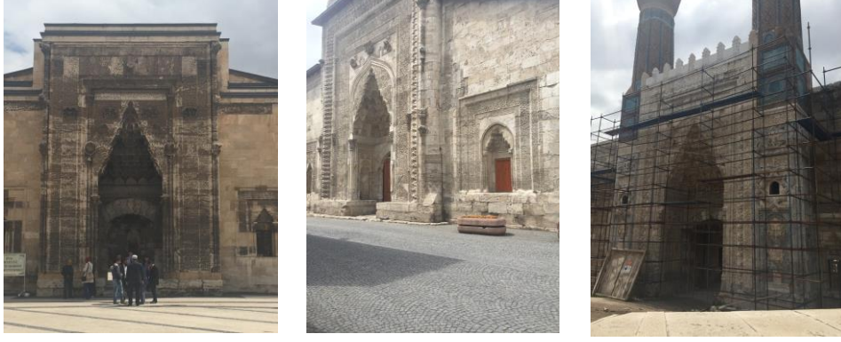
Resim 6: Buruciye Medresesi, Çifte Minareli Medrese ve Gökmedrese taçkapılarını gösteren fotoğraflar (27.04.2016).