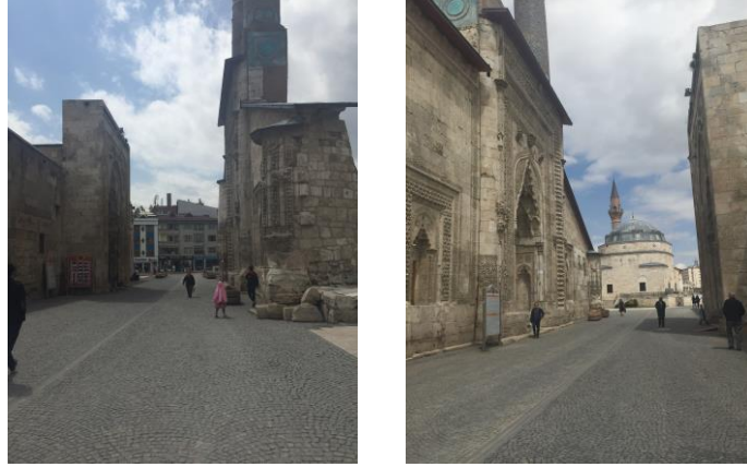
Resim 4: Çifte Minareli Medrese ve Keykavus Şifahanesi arasındaki sokak aralığı (27.04.2016).