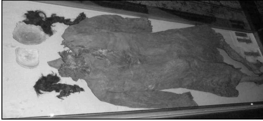
Fot. 4- Manazan mağara yerleşmesinden çıkarılan bozulmamış kadın cesedi

salon zemininde oluşan kum tabakası nedeni ile bu kata kumkale adı verilmiştir. Kumkale katından yine bir baca ile at meydanına çıkılır. Salonun sağında ve solunda iki katlı 60 hücre yer alır. Bu katta yüzeyi sıvalı bir su sarnıcı vardır. Bu kat kullanım alanının geniş olması nedeniyle, at meydanı, adını almıştır. Bu kattaki mezarlarda Bizans ve Erken Hıristiyanlık dönemi arkeolojik buluntulara rastlanmıştır. Ölü meydanı denilen son katta bugün fazlaca tahrip edilmiş mezarlara rastlanır. Bu kat duvarlarına gömülmüş (doğal mumya) 100-150 ceset çıkarılmıştır (Özkan, 2002, 11). Cesetlerin zamanımıza kadar organik yönden korunmuş olarak gelmesi tuf kayanın nem emici özelliği çürümeyi geciktirmiştir. Bu cesetlerden sağlam durumda olan genç bir kadın cesedi (Fot. 4) Karaman Müzesi teşhir salonunda bulunmaktadır.