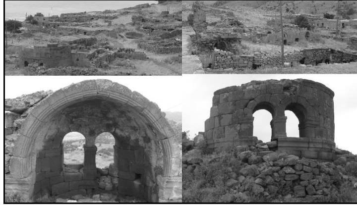
Fot. 2- Madneşehri'ndeki tarihi kalıntılar ve bugün de kullanılan köy konutları

Madneşehri (Binbirkilise): Karaman'ın kuzeyinde Karadağ üzerinde Orta Çağ Bizans sanatını yansıtan birçok kalıntı vardır. Bunlar (Fot. 2) Madneşehir Öreni, Yukarı Ören ve Değle Öreni adıyla bilinen yerlerde yoğunluk gösterir. Yöre, halk arasında Binbirkilise olarak bilinir. Burada XX. yüzyılın başlarında araştırma yapmış olan Ramsay ve Bell, köylülerin yöreyi bu şekilde adlandırmalarından esinlenerek kitaplarının adını The Thousand And One Churches koymuşlardır. Bölgedeki yapıların tarihsel süreç içerisindeki başlangıç ve bitiş tarihleri kesin olarak bilinmemekle birlikte IV. Ve IX. yüzyıllar arasına tarihlenmektedir. Binbirkilise yapıları düzgün kesme taşlarla ve kireç harcı ile inşa edilmiştir. Burada dini yapıların yanında manastırlar, sarnıçlar, mezarlar, askeri yapılar ve konutlar vardır (Karaman Kültür Envanteri, 2009, 21). Burada bugün hayvancılıkla uğraşan birkaç aile yaşamaktadır.