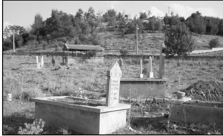
Fot. 1- Üzeri güncel yapılarla işgal edilmiş olan Yollarbaşı Höyüğü

Yollarbaşı (İlistra) Höyüğü: Höyük, Karaman merkeze bağlı Yollarbaşı kasabasında. Kasabanın İlistra olan antik ismi 1961 yılında Yollarbaşı'na çevrilmiştir. Burada yapılmış araştırmalar, şehrin Hellenistik, Roma ve Bizans çağında önemli bir koloni olduğunu göstermektedir. Yine antik çağda kendi adına sikke bastırmasından önemli bir merkez olduğu anlaşılmaktadır (Kurt, 2009, 185). Bugün höyükte ağaçlandırma için teraslama yapılmış, etrafı duvarlar ve asfalt yolla çevrilmiştir. Tepesinde park, havuz, su deposu gibi yapılar bulunmaktadır. Kuzey yamacı ve kuzeyinde mezarlık yer alır (Fot. 1). Yüzeyinde ise ortalama 2 m derinliğinde defineci çukurları açılmış olup, büyük ölçüde tahrip edilmiştir.