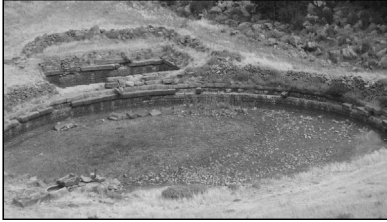
Fot. 3- Karadağ'da Roma dönemi yapısı olan tarihi su sarnıcı

yakınlarındaki Karadağ'a ait bir krater çukuru içinde elips şeklinde bir su sarnıcı havuzu bulunmaktadır. Havuzun çevresi Karadağ volkanik kayaçlarından elde edilen kesme taşlarla çevrilmiştir (Fot. 3).