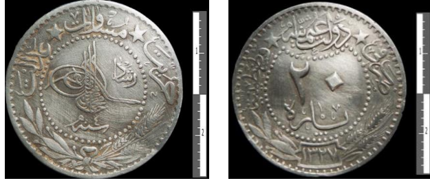
Fot. 9. Mehmed Reşad/ Nikel/ 20 Para/ Kostantiniyye/ H. 1327.