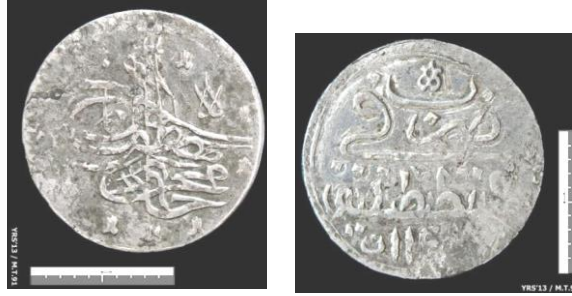
Fot. 14. I. Mahmud/ Gümüş/ Para/ Kostantiniyye/ H. 1143.