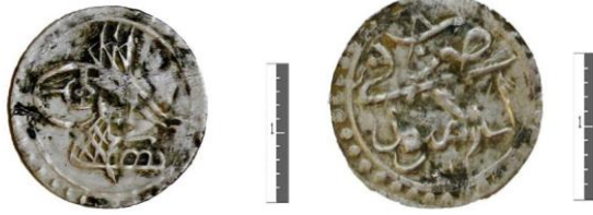
Fot. 10. III.Mustafa/ Gümüş/ Para/ İslâmbol/ H.1171.