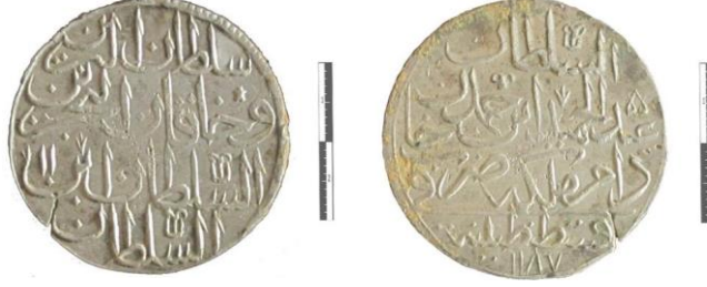
Fot. 12. I. Abdülhamid/ Gümüş/ 30 Para (Zolta)/ Kostantiniyye/ H. 1187.