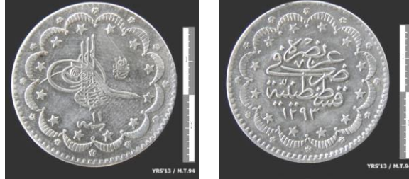
Fot. 15. II. Abdülhamid Han/ Gümüş/ 5 Kuruş/ Kostantiniyye/ H. 1293.