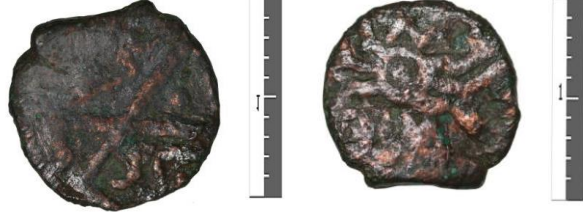
Fot. 8: II. Mehmed/ Bakır/ Mangır/ Tire.