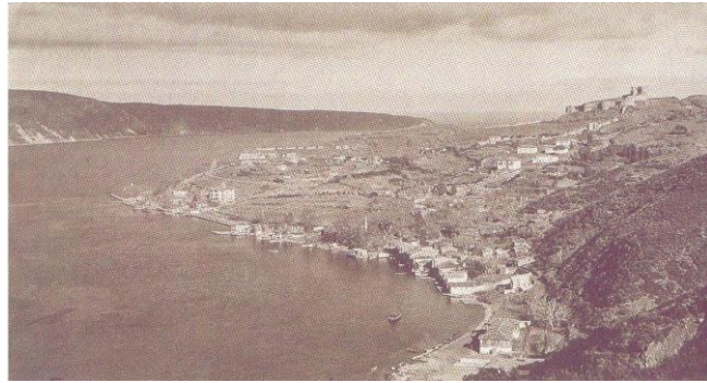
Fot. 3. Macar Tabyası sırtlarından Anadolu Kavağı ve Boğaziçi'nin Karadeniz girişi, 20. yüzyılın ilk yarısı.