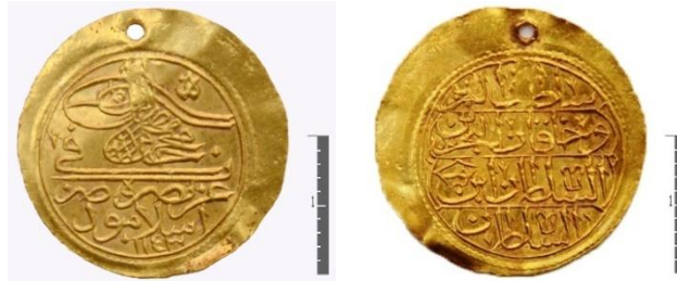
Fot. 7. I. Mahmud/ Altın/ Zer-i Mahbub (Geniş pullu)/ İslâmbol/H.1143.