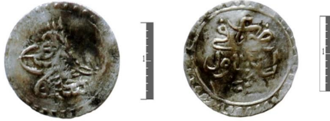
Fot. 11. III. Selim/ Gümüş/ Para/ İslâmbol/ H.1203.