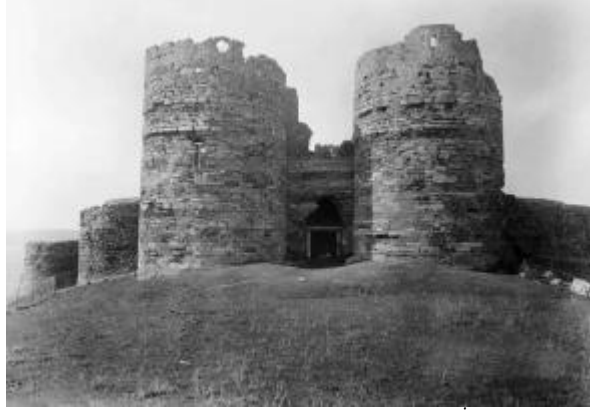
Fot. 4. 1930'lu yıllarda Yoros Kalesi doğu girişi, (Albert Gabriel, İstanbul Türk Kaleleri , Tercüman Gazetesi, İstanbul 1941.)