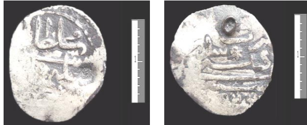
Fot. 6. I. Süleyman/ Gümüş/ Akçe/ Sidrekapısı/ H.926.