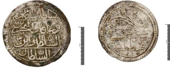
Fot. 13. II. Mahmud/ Gümüş/ 5 Para/ Kostantiniyye/ H.1223.