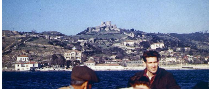
Fot. 5. Anadolu Kavağı ve Yoros Kalesi, 1961