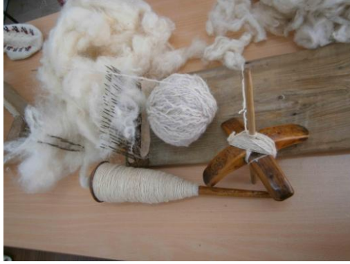
Fot. 1. Çorap örmeye kullanılan araç-gereçler

Çorap örmeye kullanılan temel malzeme “yerli koyunyünü” ya da “merinos yünüdür”(Fot. 2).