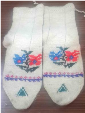
Örnek No : 3

Kullanılan Renkler: Doğal krem rengi, kırmızı, lacivert, bordo ve yeşil