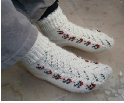
Örnek No : 7 Desen Adı: Çiçekli çorap (model ismi tam bilinmiyor) Kullanılan Renkler: Doğal krem rengi, kırmızı, yeşil