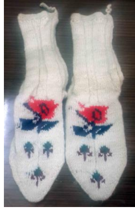
Örnek No : 2

Kullanılan Renkler: Doğal krem rengi ve siyah