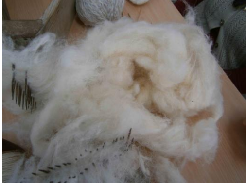
Fot. 2. Çorap örmeye kullanılan yün

Çorap örmeye kullanılan temel malzeme “yerli koyunyünü” ya da “merinos yünüdür”(Fot. 2).