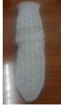
Örnek No : 8 Desen Adı: Model ismi tam bilinmiyor Kullanılan Renkler: Açık mavi

Araştırmada elde edilen çorap örnekleri incelendiğinde daha çok boyasız doğal yünden örüldüğü, örülme sırasında boyanmış liflerle desenlerin oluşturulduğu görülmektedir. Çoraplarda en çok kullanılan renkler kırmızı, yeşil, siyah, bordo ve mavi renklerdir. Uygulanan desenler isimlerini doğadan esinlenilerek bitki ve hayvanlardan almaktadır. Bu desen isimlerine koç boynuzu, sinek kanadı, karanfil, küpeli, söğüt yaprağı ve kelebek örnek verilebilir. Ayrıca araştırma örneğine katılan kadınlar yün çorabın özellikleri konusunda sıcak tuttuğunu, yünün ter emme özelliğinden dolayı koku yapmadığını ve çok sağlıklı olduğunu belirtmişlerdir.