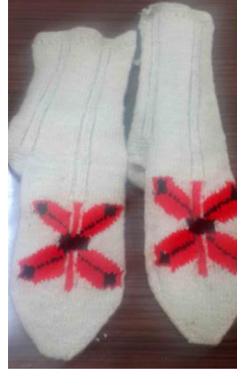
Örnek No : 6 Desen Adı: Kelebek Kullanılan Renkler: Doğal krem rengi, kırmızı, bordo