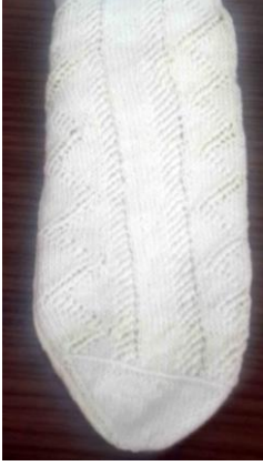
Örnek No : 5 Desen Adı: Ajurlu Kullanılan Renkler: Doğal krem rengi