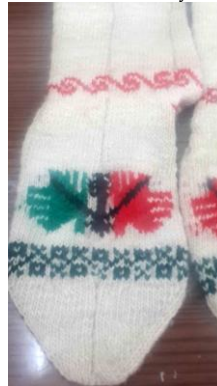
Örnek No : 4

Kullanılan Renkler: Doğal krem rengi, kırmızı, mavi, pembe, saks mavisi ve koyu yeşil