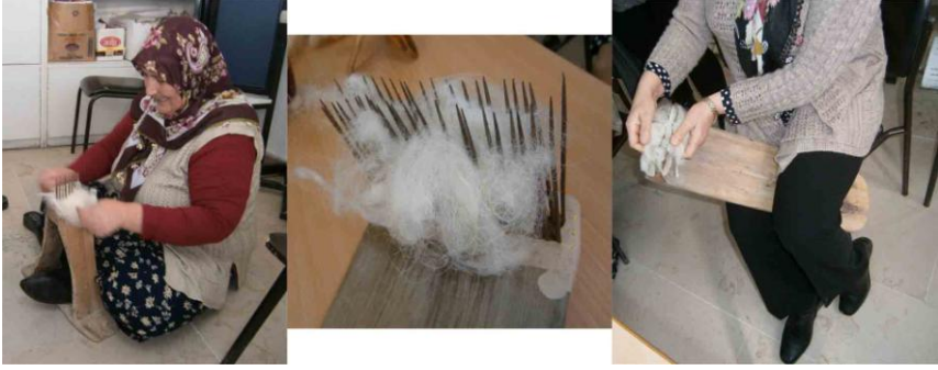
Fot. 3. Çorap örmeye kullanılan tarak ve kullanım şekilleri

Tarama işleminden sonra yünler oklava şeklindeki araca sarılarak ve bükülerek “kolçak” yapılmaktadır (Fot. 4). Kolçak kol altına yerleştirilerek kirman ya da iğ ile yünler eğrilmektedir (Fot. 5). Yünler eğrildikten sonra yumak haline getirilmekte ve örme işlemine başlanmaktadır.