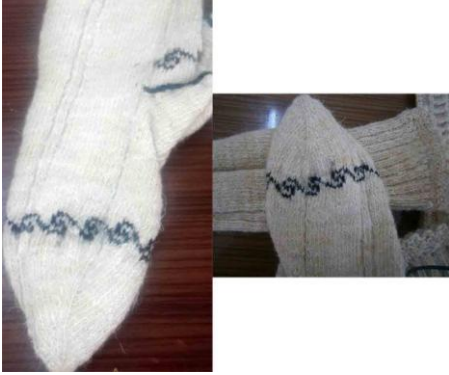
Örnek No : 1