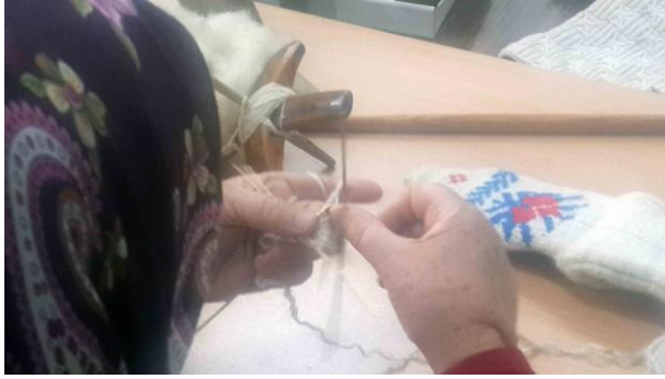
Fot. 6: Çorap örme

Örnekleme yer alan kadınlardan bir diğeri ise çorap örmeyi şöyle anlatmıştır. “Dokuz sayıdan başlıyor çorabın ucunu. Topuğu ayrı örülüyor. Burundan başlanıyor topuğa kadar geliyor. (Çorabın boğazında ters örgü yer almakta) (Çorabın arkasında yer alan ters örgü) model hocam oraya ters (örgü) koyuyorlar açılıyor. Çorap daha rahat ayağa girip çıkıyor. ...likralı kumaş değil bunlar malum örgü olduğu için daha rahat girsin çıksın ayağa. ...boyun kısmına ip takılıyor (düşmesin diye)”.