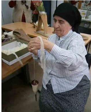
Fot. 5. İğ ile yün eğirme

Yünler eğrilerek ip haline getirildikten sonra örme işlemine geçilmektedir (Fot. 6). Bu işlem örnekleme yer alan kadınlardan biri tarafından şu şekilde anlatılmaktadır: “Önce sekiz ilmekten başlıyon. Beş şişle iki taraftan birer tane fazlaştırıyorsun. Bir dal dolanıyon bir daha ayağın büyüklüğüne göre.