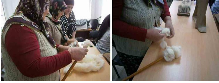
Fot. 4. Çorap örmeye yünlerin kolçak yapımı

Tarama işleminden sonra yünler oklava şeklindeki araca sarılarak ve bükülerek “kolçak” yapılmaktadır (Fot. 4). Kolçak kol altına yerleştirilerek kirman ya da iğ ile yünler eğrilmektedir (Fot. 5). Yünler eğrildikten sonra yumak haline getirilmekte ve örme işlemine başlanmaktadır.