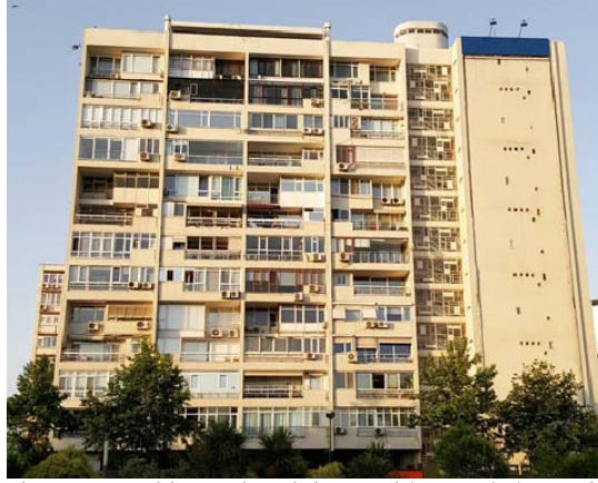
Şekil 4. Hukukçular Sitesi, Melih Birsal, Haluk Baysal (1958-61).

ferah iç mekan kurguları, gerek de dönemin trendlerinden olan mimarlık-sanat ilişkisini seramik, mozaik panolar ile birlikte takip etmeleri ile kullanıcıların talep ettikleri ürünlere dönüşür ve ideal evin bu dönemdeki popüler karşılıklarından biri haline gelir (Aziz Gorbon'la görüşme).