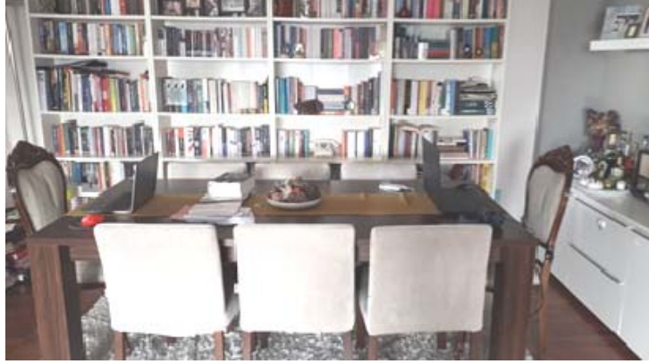
Şekil 1. İki kişilik çalışma alanına dönüşen yemek masası