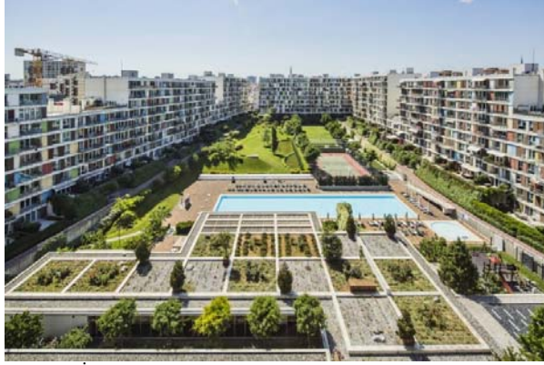
Şekil 5a. İstanbul'da kapalı site örneği (Evidea)

kaçarak yeşil alan içinde olma isteği gibi nedenlerin sonucunda kapalı site kavramı ortaya çıkar. Ortak -yüksek- statü ve sosyo-ekonomik benzerlik arayışında olan homojen bir kullanıcı grubunun söz konusu olduğu bu güvenli, korunaklı ve çoğu zaman kent merkezinin dışında konumlanan kapalı siteler, hem içerdikleri sosyal donatılar nedeniyle (Akalin, 2016) hem de dış dünyadan kopmuş mahremiyet olgusuna odaklanan bir hayat sundukları için ideal ev olarak önerilir.