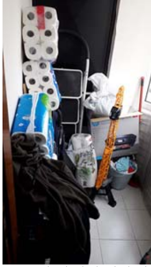
Şekil 2a. Depo olarak işlevlendirilen balkon