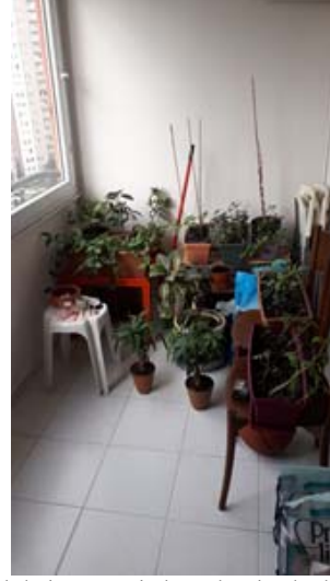
Şekil 2b. Kısmi bahçe olarak işlevlendirilen balkon.

Bu yazı, pandemi sürecinde çalışmaya evden devam eden iki akademisyenin zamanla üzerinde düşünmeye başladıkları ev kavramını, bu süreçte evlerdeki değişim/dönüşüm hallerini ve ideal ev olgusunun karşılıklarını sorgulamayı amaçlar. Bu sorgulamalar ışığında kuramsal altyapısı ev kavramı üzerine kurgulanan yazı ayrıca ideal olan evin tarihsel süreçteki farklı anlamlarının/anlatımlarının üzerine de düşünür. İstanbul üzerinden bir ideal ev okuması yaparak ilerleyen yazı süreç içinde mimarlık literatüründe karşımıza çıkan “ideal ev” tanımlamalarına değinir. 20. yüzyılın başından günümüze bu konuda yaşanan değişimlerin nedenlerini sorgularken okuyanı ideal evin tanımının değişimi üzerine düşünmeye davet eder. Aynı zamanda bu tanımın neden değiştiğini, neden yeniden tanımlanması gerektiğini sorgulamaya çalışır. Bu bağlamda, ideal ev anlayışının Covid-19 süreci ile yeniden değişime/dönüşüme uğradığını düşünen yazarlar kartopu yöntemi ile online bir anket yapar. Kapalı ve açık uçlu sorulardan oluşan ankette katılımcıların pandemi sürecinde evlerinde yaşadıkları mekânsal deneyimleri ve ev-ideal ev kavramları hakkındaki fikirleri pandemi öncesi ve sonrası bağlamında sorgulanır. Böylece pandemi nedeniyle ideal ev algısının anket katılımcıları bağlamında nasıl karşılık bulduğu anlaşılmaya çalışılır.