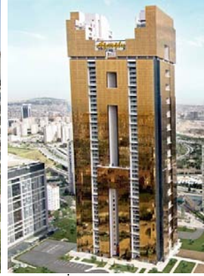
Şekil 5b. İstanbul'da rezidans örneği (Andromeda Gold)

1990'lı yıllarda karşımıza çıkan kapalı siteler, gereksinim duyulan alanın büyük olması nedeniyle İstanbul'un merkezi alanları için genellikle geçerli bir çözüm sunamaz. Bu noktada, özellikle 1999 depreminden sonra, 2000'li yıllarda, yeni bir konut formülü arayışına gidilir. Bu formül, kent merkezinde konumlanan, herhangi bir depremde risk taşımayacak ve yine güvenli ve konforlu bir yaşam sunan rezidanslardır (Yüksel ve Akbulut, 2009) (Şekil 5).