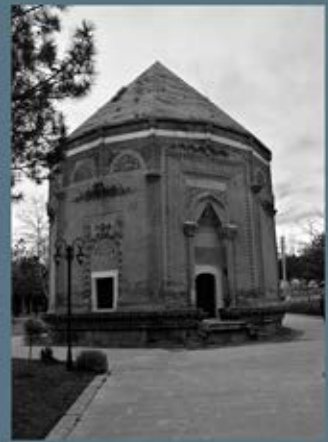
Hüslavent Hatun Türbesi

Scientific Research Institute of Turkish - Islamic Civilization