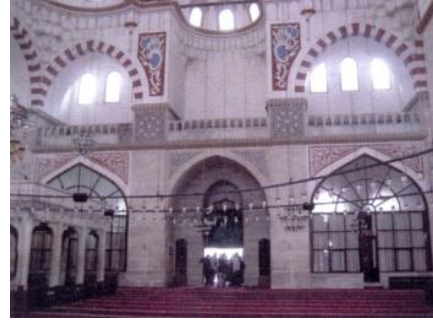
Fot.4. Kuzey duvarı görünüşü (Kutlu, 2012).

Hünkâr mahfili mihrap duvarının solunda, sütunlar üzerinde yer almaktadır. Hünkâr mahfilinin bir köşesi, fil ayağına dayanmaktadır (Fot. 5). Boyutları, yaklaşık olarak 6.50m×7.50m'dir (Çamay, 1989). Hünkâr mahfilinin, doğu cephesinden ayrı bir girişi bulunmaktadır. Giriş kısmı, avlu zemininden yüksekte ve basamaklıdır (Fot 6). Payanda içinde bulunan bir merdivenle çıkılarak, bir kapıdan geçilmekte ve mahfile girilmektedir.