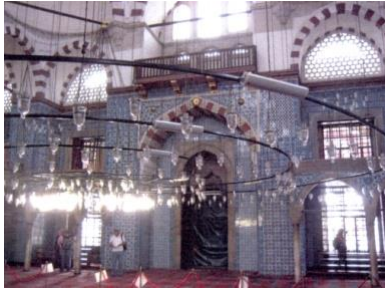
Fot.15. Kuzey duvarı (Kutlu, 2012).

Eminönü semtinde yer alan Rüstem Paşa Camisi'nin kuzey, doğu-batı cephesinde mahfiller bulunmaktadır (Fot. 15, 16). Kuzey duvarı cami giriş kapısı üzerinde yer alan mahfile çıkış kapısı bulunmamaktadır. Kuzey cephe duvarı üzerinde yer alan mahfilin, doğu-batı duvarı üzerinde yer alan mahfillerle bağlantısı bulunmamaktadır. Caminin dış duvar kısmına yerleştirilmiş, doğu-batı cephesinde yer alan kapılardan üst kata erişim sağlanmakta ve doğu-batı duvar üzerinde yer alan mahfil kısımlarına ulaşılmaktadır.