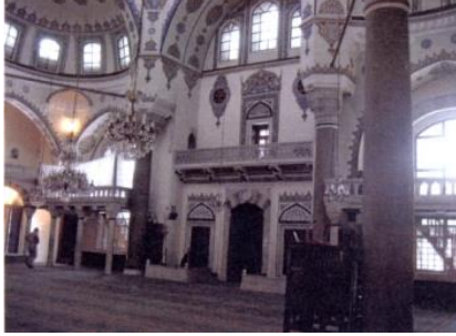
Fot.13. Kuzey duvarı görünüşü (Kutlu, 2012).