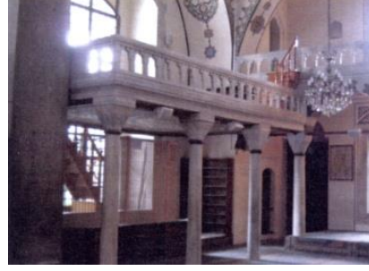
Fot.14. Mahfil görünüşü (Kutlu, 2012).