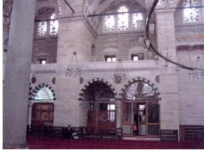
Fot.11. Kuzey duvarı görünüşü (Kutlu, 2012).