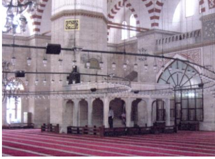
Fot. 3. Müezzin mahfili (Kutlu, 2012).

Camide doğu-batı duvarında ve kuzey duvarı üzerinde mahfiller yer almaktadır. Kuzey duvarı üzerinde yer alan mahfil kısımları, giriş kapısının hemen üzerinde olup, günümüzde sadece Cuma günleri, erkek cemaate açılmaktadır (Fot. 4). Kuzey duvarında yer alan üst kat mahfillere çıkış kapıları, caminin ana giriş kapısının sağ ve sol kısımlarında yer almaktadır. Ayrıca, doğu-batı yönünde, yan giriş kapıları üzerinde yer alan, çıkışı olmayan ve diğer mekânlara geçişi olmayan mahfiller de bulunmaktadır.