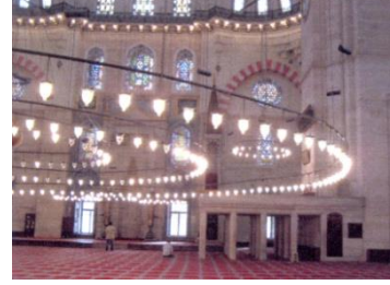
Fot.8. Müezzîn mahfili (Kutlu, 2012).