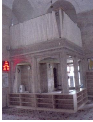
Fot.2. Mahfilden görünüş (Kutlu, 2012).

Mahfili taşıyan sütunlar mermerden yapılmış olup, sütun başlığı yer almamaktadır. Kirişlerin üzerinde bir sıra mukarnas dizisi ve korkuluk bulunmaktadır. Korkuluk, geometrik desenlerle süslenmiştir (Fot. 2).