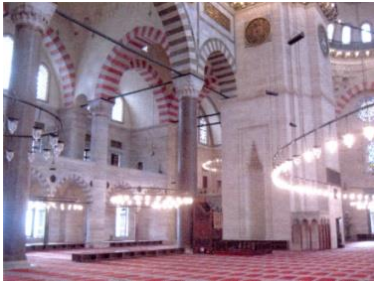
Fot.9. Doğu duvarı görünüşü (Kutlu, 2012)