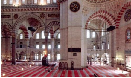
Fot.7. Hüncâr mahfili (Kutlu, 2012).