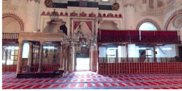
Fot.1. Caminin mahfil kısmından görünüşü (Üsküdar Belediyesi, 2012).

daha yüksektir. Hünkâr mahfili olarak tasarlansaydı, girişi ayrı ve konumu mihrap duvarı önünde bir yerde olabilirdi.