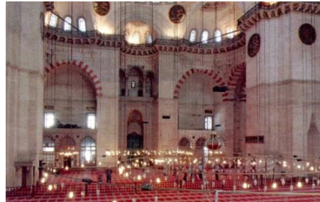
Fot.10. Kuzey duvarı görünüşü (Kutlu, 2012)