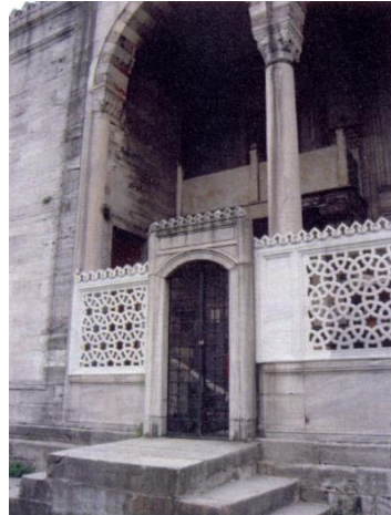
Fot.6. Hünkâr mahfili girişi (Kutlu, 2012).