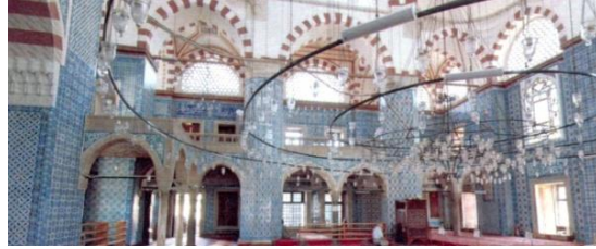
Fot.16. Doğu cephesi duvarı (Kutlu, 2012).